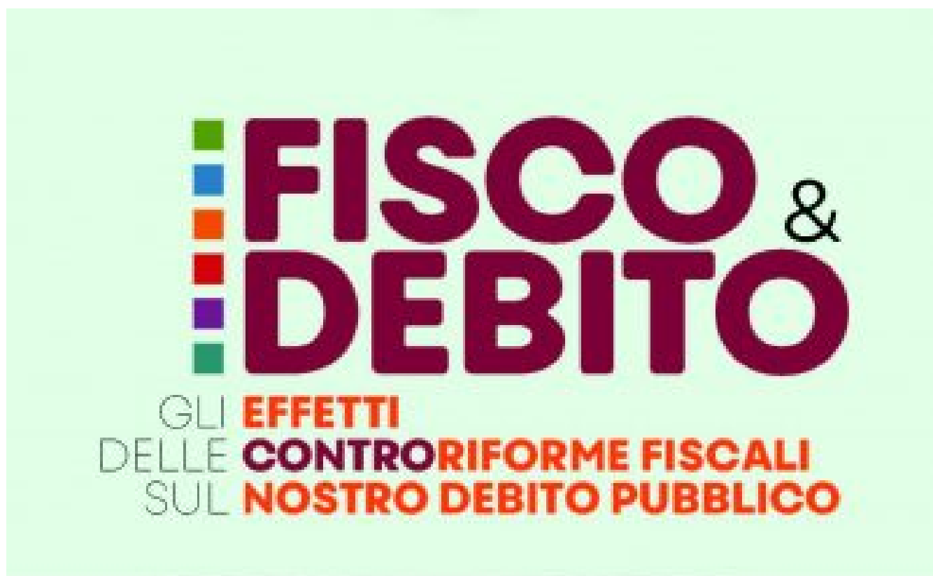
Fisco & debito